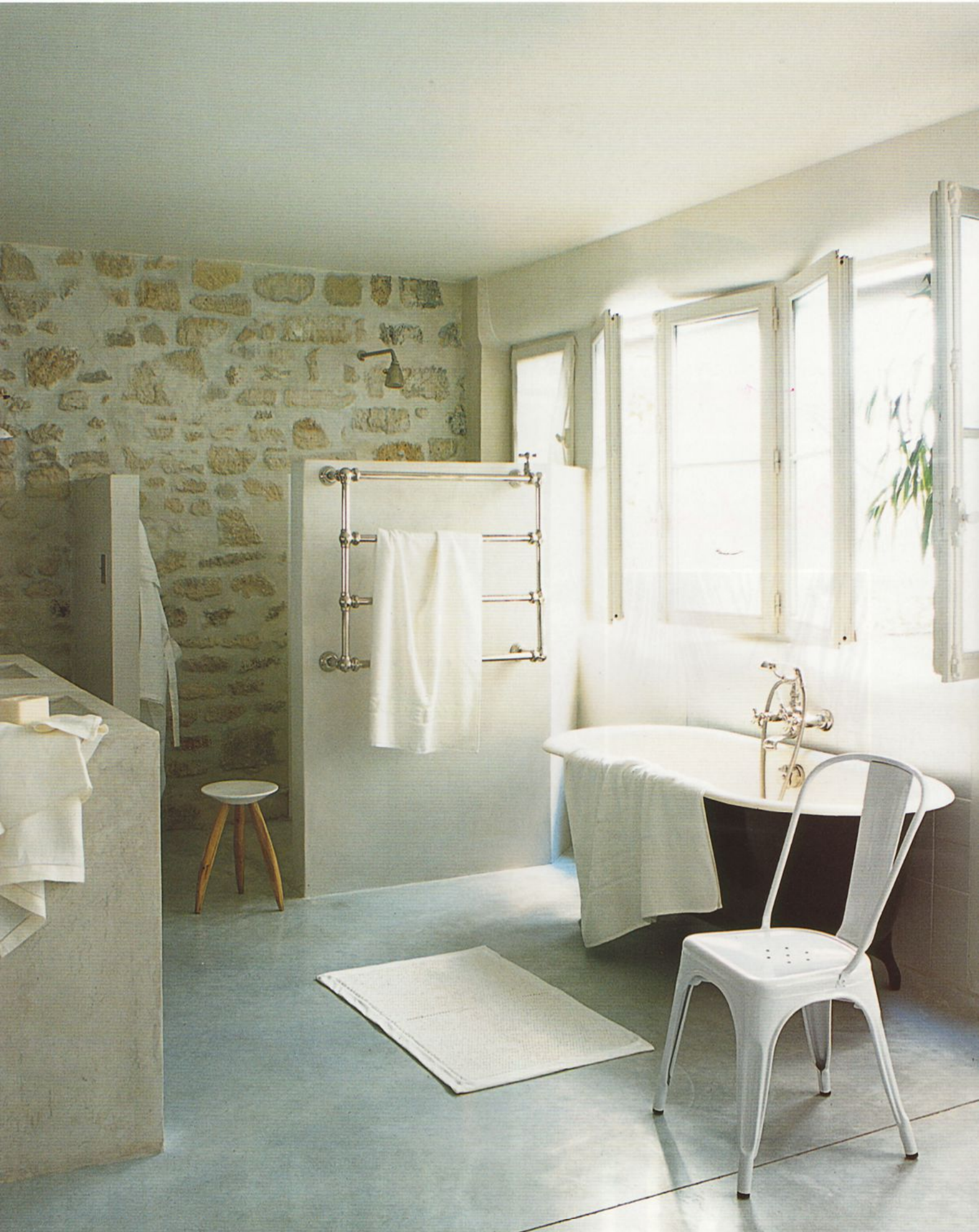
D'inspiration Sud, la salle de bains se pare de pierre et de béton lissé... Serviette en lin sur le bloc bain, tapis de bain natté et peignoir en lin, Côte Bastide. Sur la baignoire ancienne et sur le sèche-serviettes Stella, draps de bain The Conran Shop, Chaise Tolix et tabouret Home Autour du Monde.