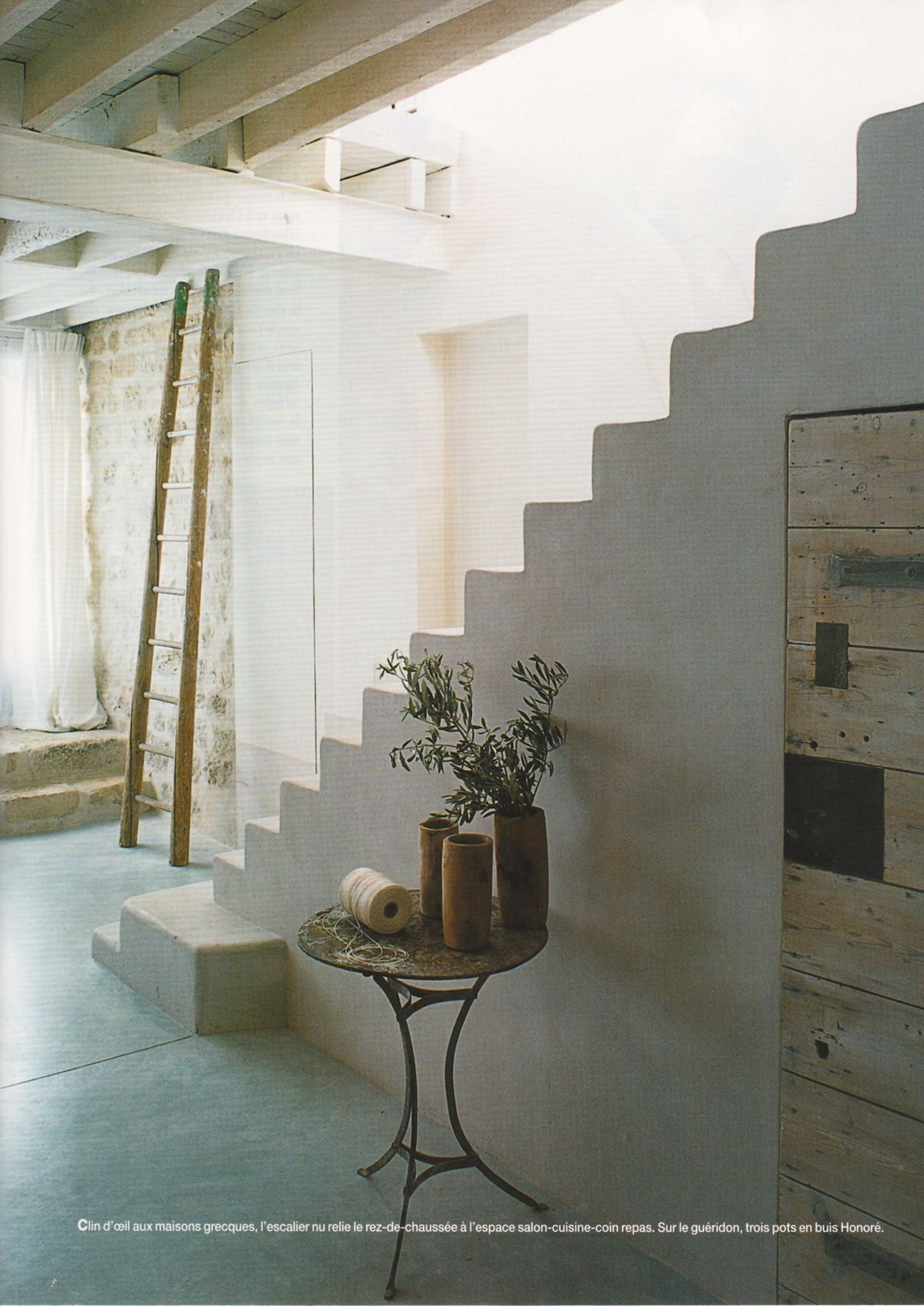
Clin d'œil aux maisons grecques, l'escalier nu relie le rez-de-chaussée à l'espace salon-cuisine-coin repas. Sur le guéridon, trois pots en buis Honoré.